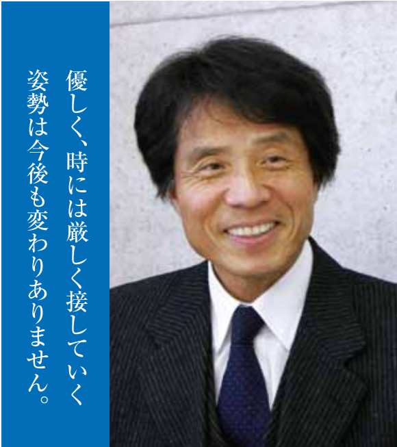
優しく、時には厳しく接していく 姿勢は今後も変わりありません。